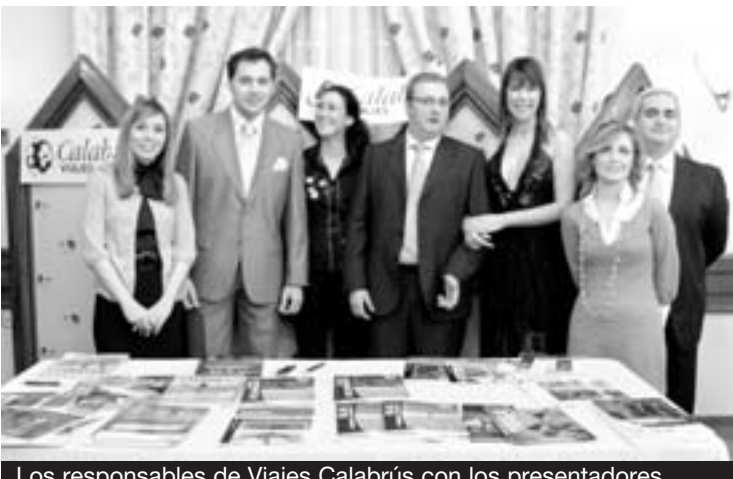
Los responsables de Viajes Calabris con los presentadores.

La luna de miel es, posiblemente, el viaje más importante en la vida de una pareja. Por ese motivo es necesario confiar en una empresa de confianza y con experiencia para que nada falle. Viajes Calabris lleva siete años participando en la Gran Gala Juleca. En la fiesta mostró una serie de productos y ofertas de viajes especialmente diseñados para los novios. La empresa contribuyó al éxito de la gala con el sorteo de dos viajes, un crucero y un fin de semana en las Baleares, para las parejas de novios. ■