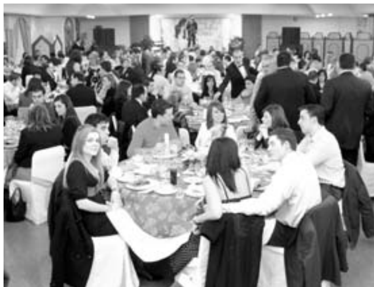
Las parejas disfrutaron de la cocina del Juleca durante la velada.

La XVI edición de la gala fue todo un éxito con la presencia de centenares de parejas que confían en la experiencia del Complejo Juleca para organizar su celebración de bodas. ■