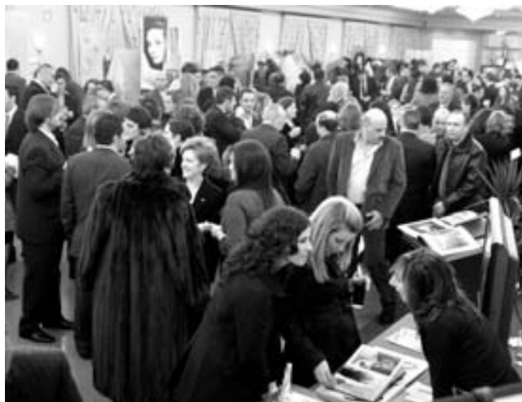
Gran ambiente en la zona de exposición de las empresas.