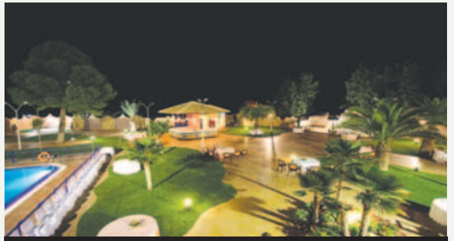
Baile en los jardines de la piscina.