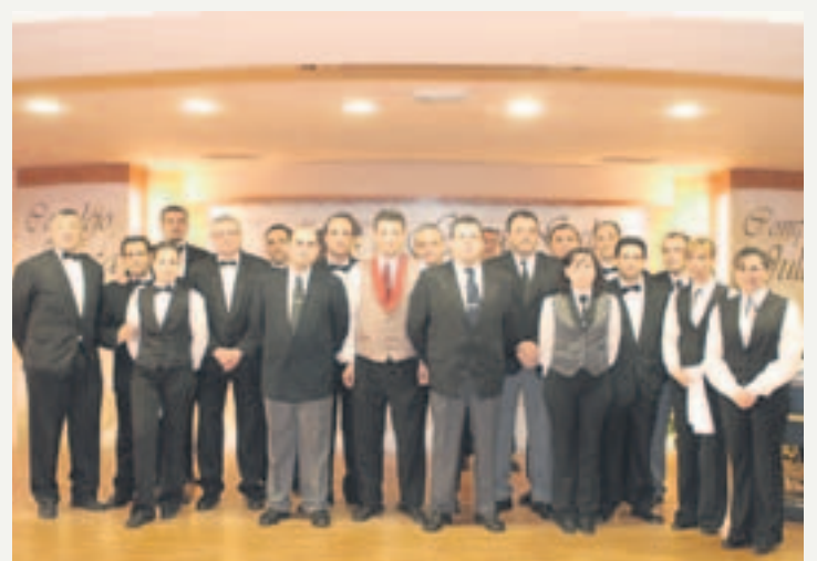
Equipo de camareros del Complejo Juleca.