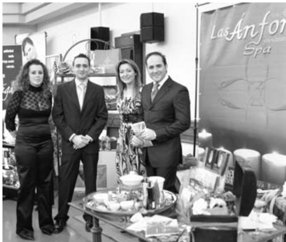
Los responsables de Las Ánforas Spá, en su stand en la Gran Gala Novios.