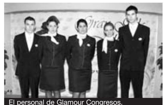
El personal de Glamour Congressos.