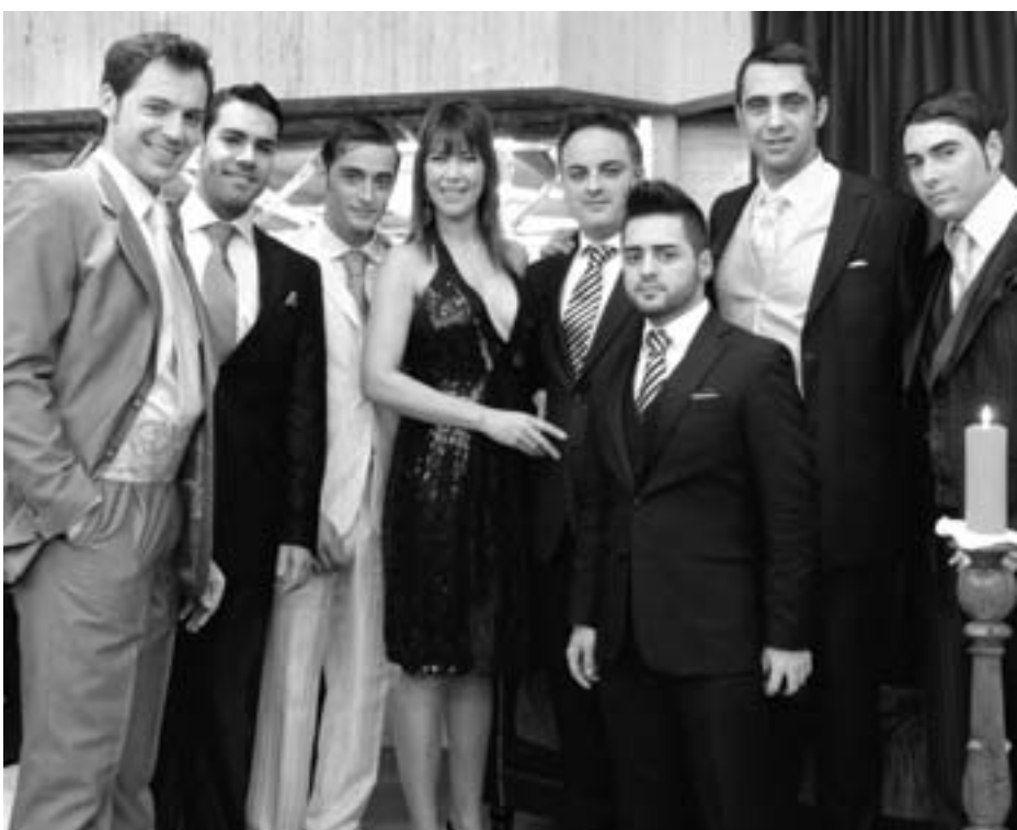
Los responsables de Ángela Serrano con los modelos y presentadores de la gala.

Amueblar un hogar es una de las tareas más complicadas para las parejas que comienzan su vida en común. Ángel Muebles cuenta con la gama más completa y con los mejores profesionales para asesorar a los clientes a la hora de amueblar su vivienda. Ángel Muebles es distribuidor de alguna de las mejores firmas de muebles del mercado. En la Gala Juleca, las parejas pudieron encontrar algunas de estas propuestas. ■