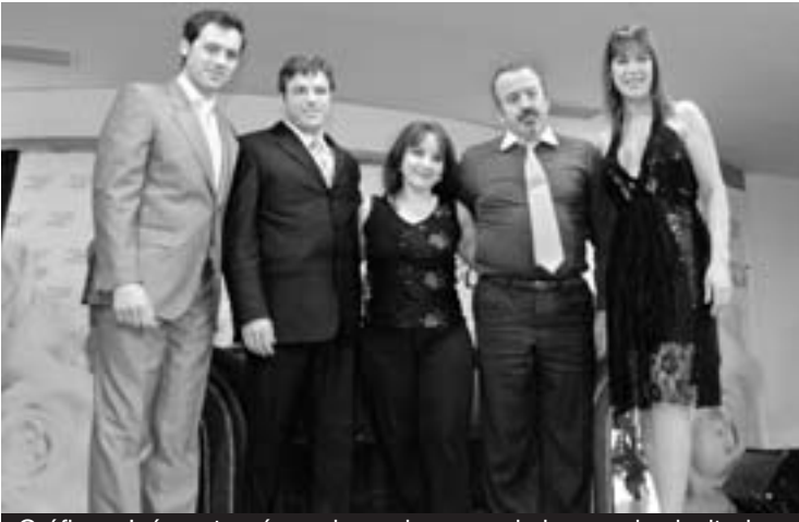
Gráficas Jaén entregó un obsequio a una de las parejas invitadas.

Ya en la primera edición de la Gran Gala Juleca Novios estuvo presente la firma Gráficas Jaén. Un año más, la empresa no faltó al salón dedicado a los novios con un expositor en el que se presentaron las últimas novedades y tendencias en tarjetas de boda. La invitación es uno de los detalles de boda más importantes y en los que la imagen es fundamental. Gráficas Jaén dispone del surtido más amplio de diseños para personalizar las tarjetas, desde los más modernos a los más clásicos. ■