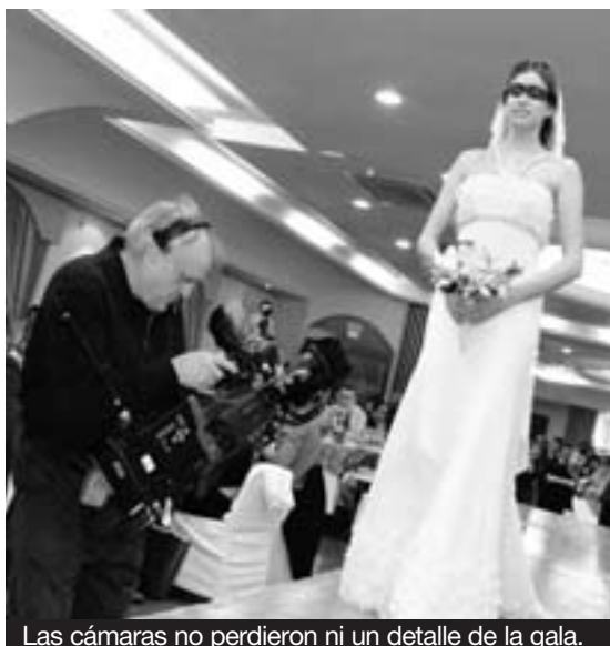
Las cámaras no perdieron ni un detalle de la gala.

La productora de televisión Francisco Vílchez S. L. es veterana en la realización y grabación de la Gran Gala Juleca Novios. La empresa jiennense es una de las productoras con mayor expansión en los últimos años gracias a su enorme experiencia en la retransmisión y producción de toda clase de acontecimientos sociales, deportivos o culturales en toda España. La productora Francisco Vílchez grabó la gala para su posterior emisión en televisión. La empresa es una excelente opción para aquellas parejas que quieran grabar su boda con la garantía y profesionalidad de la productora. ■