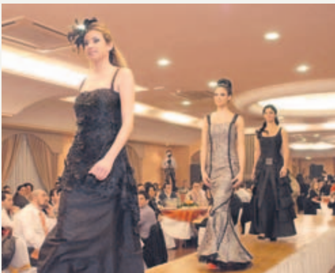
Espectacular desfile de los diseñadores Hermanos Cardú.